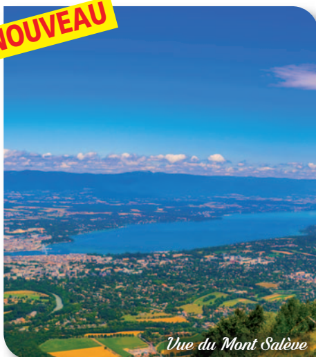
Vue du Mont Salève