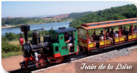
Train de la Loire